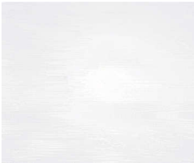
( https://jamkrida-jabar.co.id/ )