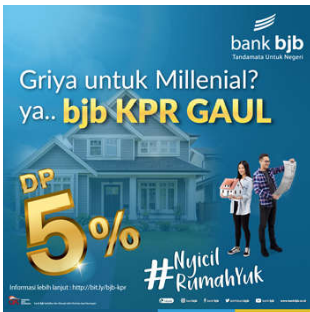
( https://www.bankbjb.co.id )