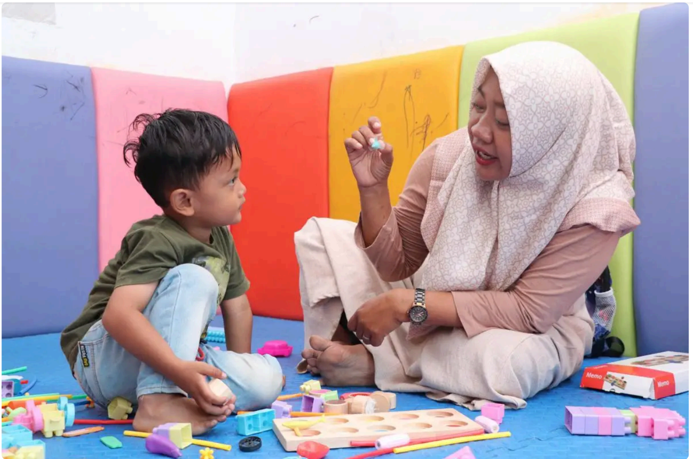
Seorang anak laki-laki diajari mengenal bentuk ikan yang menjadi sumber protein bagi kebutuhan PMT program stunting Desa Kluwut Brebes.

Edi menilai, program MBG adalah momentum emas untuk memperbaiki gizi nasional melalui pengaturan siklus logistik beras yang lebih ketat. Menurut dia, penggunaan beras baru atau segar secara ekonomi sangat masuk akal jika manajemen stok dilakukan dengan transparan.