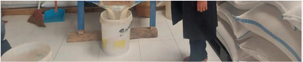
Tim Pendamping Unnes memantau produksi beras organik di lokasi Gapoktan Ngudi Makmur Magelang.